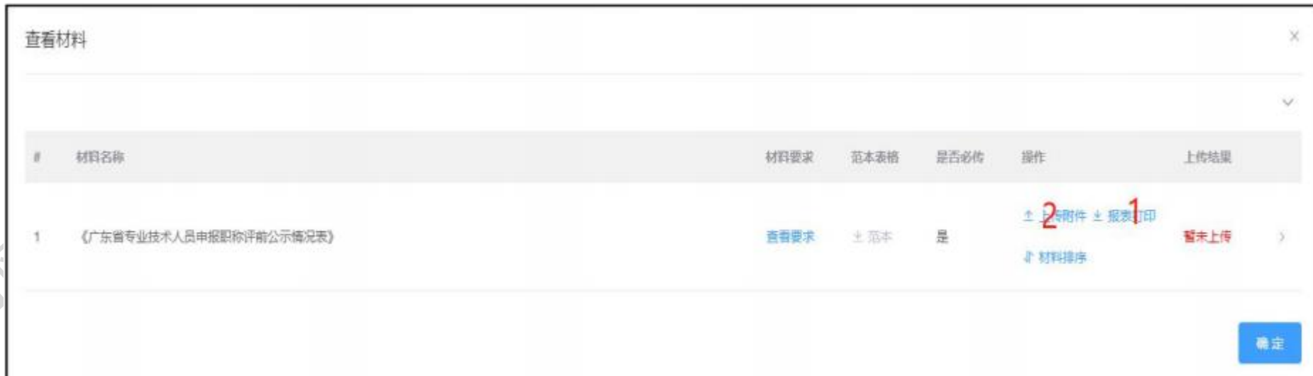
广东省专业技术人员申报专业技术资格评前公示情况表