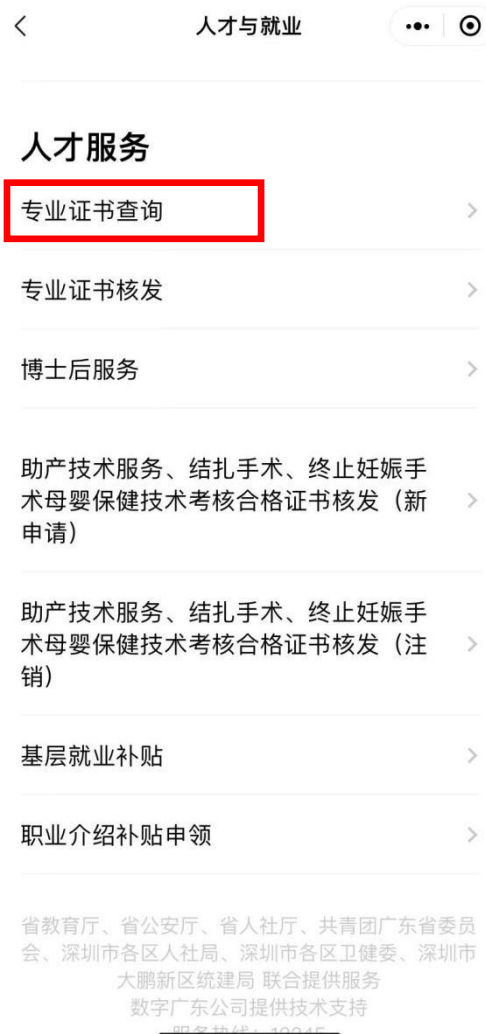
人才服务-专业证书查询