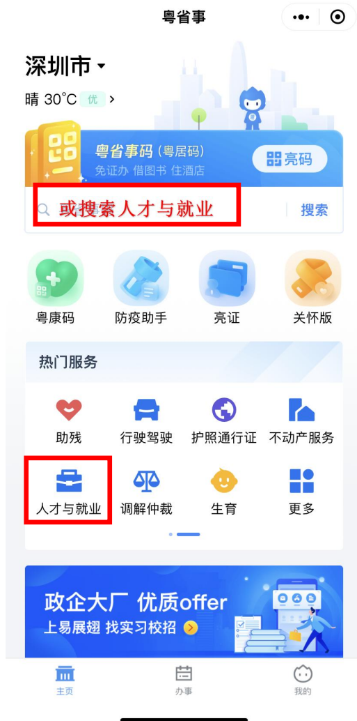
打开微信粤省事小程序找到“人才与就业”