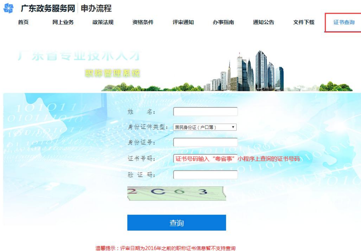
登录系统（ https://www.gdhrss.gov.cn/gdweb/ggfw/web/pub/ggfwzyjs.do ） 证书查询栏--输入姓名--证件号码--证书号码--点击查询击查询