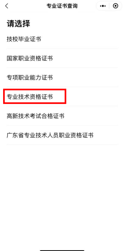
专业技术资格证书